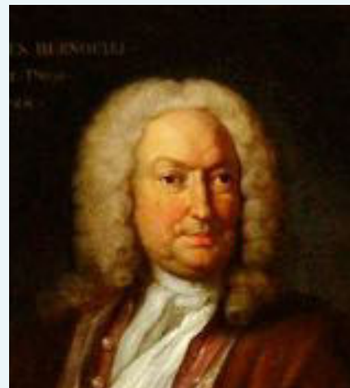
Svizzera 1667 - 1748

Solo nel 1950 la corrispondenza fra i due matematici ha portato a stabilire che il teorema era stato formulato per la prima volta da Bernoulli, maestro di de l'Hôpital.