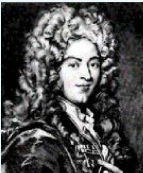
Francia 1661 - 1704