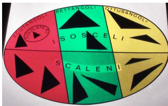
Il linguaggio degli insiemi per classificare triangoli

'Il linguaggio degli insiemi potrà essere usato come strumento chiarificatore, di visione unitaria e di valido aiuto per la formazione di concetti. Si eviterà comunque una trattazione teorica a sè stante, che sarebbe, a questo livello, inopportuna'.