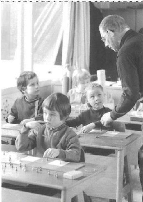
Bambini a scuola da Georges Papy

Eppure, ancora all'inizio degli anni '70, proprio a Bruxelles, dove Papy sperimentava l'introduzione della 'matematica moderna' con studenti dai 6 ai 18 anni, c'era anche l'Ecole Décroly, dove i docenti continuavano a seguire le indicazioni di Ovide Décroly e insegnavano una matematica centrata sugli interessi degli studenti e su un forte collegamento con la realtà. Anche in questa scuola si parlava di insiemi, ma in modo semplice e, direi, occasionale, quando erano utili per catalogare oggetti e figure. Ricordo le discussioni appassionante del nostro gruppo di insegnanti, dopo aver partecipato alle lezioni di tutte e due le scuole; si azzardavano previsioni (e speranze): quale metodo si sarebbe diffuso su larga scala?