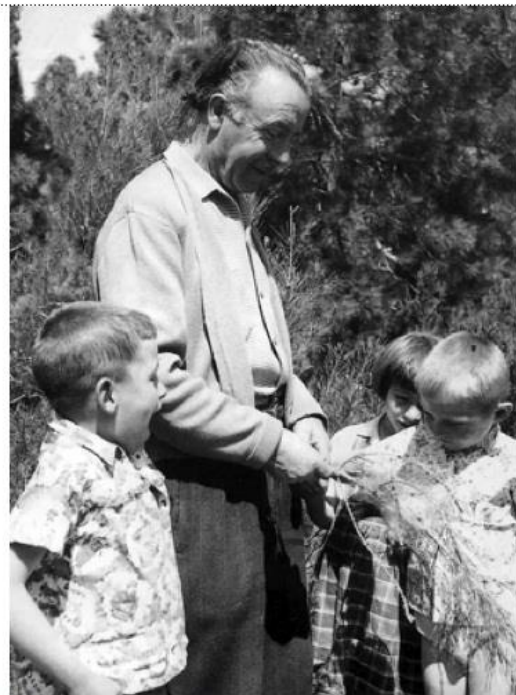
Bambini all'Ecole Décroly

Ancora agli inizi degli anni '70, sembrava divampare la 'matematica moderna', con poche opposizioni, ma una nuova crisi era vicina. Nell'agosto del 1976, in occasione del Congresso Internazionale sull'Insegnamento della Matematica ( ICME3 ), il matematico inglese Michael Atiyah , in una conferenza plenaria, accusò i matematici di aver soppresso nella maggior parte dei paesi l'insegnamento della geometria nelle scuole secondarie a qualunque livello.